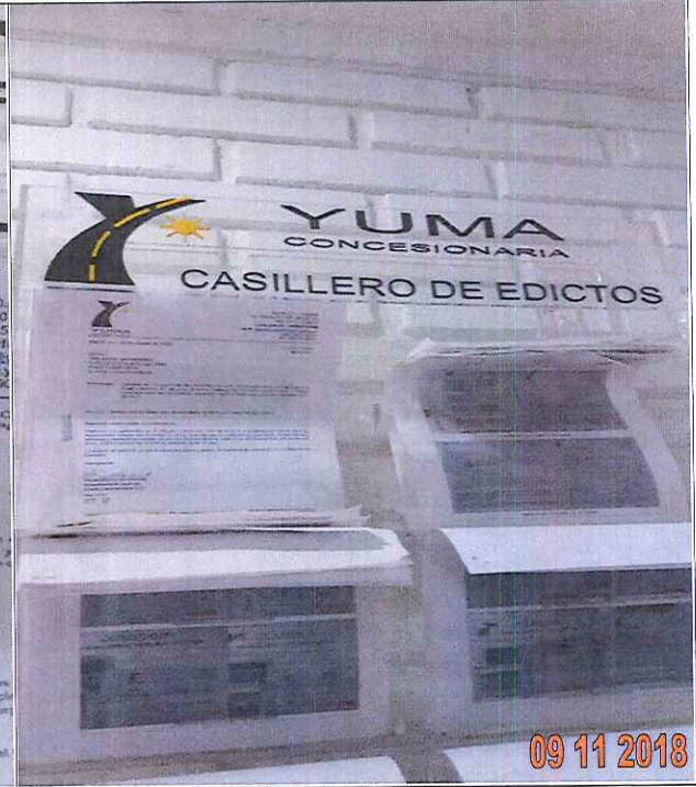
EDICTOS DE LA R_19728 YC-CRT-73362